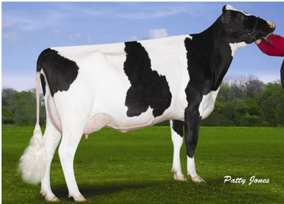
OCD PLANET DIAMOND Dam